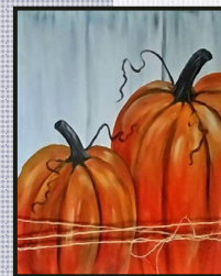
Calabazas Jueves, 10 de octubre de 6:00-8:30pm

Este programa invita a participantes de todos los niveles de habilidad a explorar su creatividad en un lienzo de 16 "x 20". Siguen las instrucciones paso a paso para crear una obra de arte única, o dejen que la imaginación les guíe. ¡Se proporcionarán suministros y orientación, para que puedan centrarse en disfrutar del proceso y crear una obra maestra! Bebidas disponibles para la compra. $35/persona por evento. Mayores de 16 años. La fecha límite de inscripción es de una semana antes de la fecha del evento - $5 tarifa tardía después. Min/Max: 10/ 25