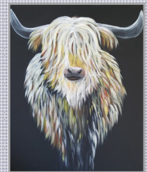
Vaca de Montaña Jueves, 27 de febrero de 6:00-8:30pm